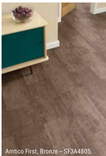
Amtico First, Bronze – SF3A4805.

Amtico First se představy zhmotňují do reality položené podlahoviny, jejíž dekor je tak neobyčejný, že zaujme na první pohled. Okouzlení hledíme právě v použití netradičních, vymyšlených vzorů, které byly vytvořeny jako protipól dnes tak notoricky známým dekorům dřeva a kamene. Právě v této abstraktní kolekci jde o posouvání estetických hranic podlahy v interiéru do nové dimenze. Amtico First nabízí osm abstraktních vzorů , z nichž za zmínku určitě stojí lineární hrátky s názvem Mirus ve dvou provedeních a také dekory surové oceli nebo třeba bronzu. Imitace kovů je inovativní a používá se do všech typů místností včetně schodišť a koridorů. I zde platí veškeré výhody vinylové podlahoviny v dílcích. Lze kombinovat s kamennými nebo dřevěnými dekory. PU povrchová úprava s keramickými nanočásticemi ochrání povrch krytiny před nejběžnějšími mikroškrábanci.