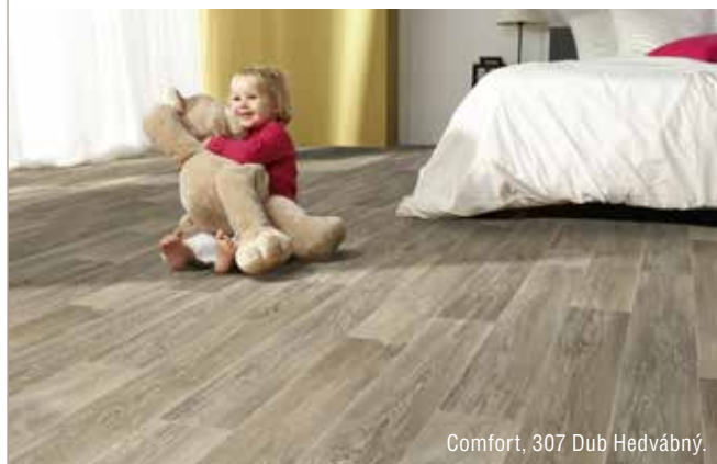
Comfort, 307 Dub Hedvábný.