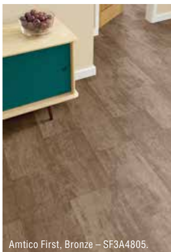
Amtico First, Bronze – SF3A4805.

Amtico First se představy zhmotňují do reality položené podlahoviny, jejíž dekor je tak neobyčejný, že zaujme na první pohled. Okouzlení hledíme právě v použití netradičních, vymyšlených vzorů, které byly vytvořeny jako protipól dnes tak notoricky známým dekorům dřeva a kamene. Právě v této abstraktní kolekci jde o posouvání estetických hranic podlahy v interiéru do nové dimenze. Amtico First nabízí osm abstraktních vzorů , z nichž za zmínku určitě stojí lineární hrátky s názvem Mirus ve dvou provedeních a také dekory surové oceli nebo třeba bronzu. Imitace kovů je inovativní a používá se do všech typů místností včetně schodišť a koridorů. I zde platí veškeré výhody vinylové podlahoviny v dílcích. Lze kombinovat s kamennými nebo dřevěnými dekory. PU povrchová úprava s keramickými nanočásticemi ochrání povrch krytiny před nejběžnějšími mikroškrábanci.