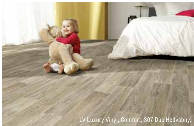
LV Luxury Vinyl, Comfort, 307 Dub Hedvábný.