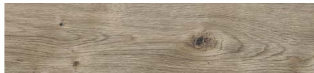
Sun Bleached Oak