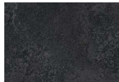
Wave Slate Black